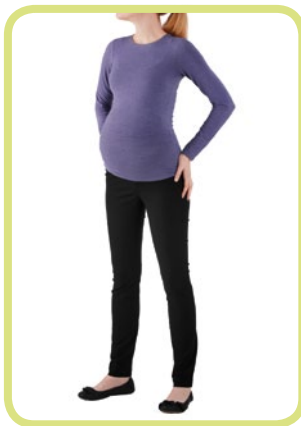
Röhre 530/33 9