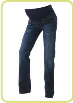
Röhre 131/72 8