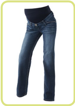
Straight Leg 323/95 8