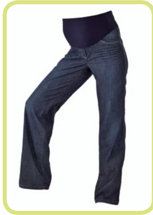
Loose Fit 520/14 8