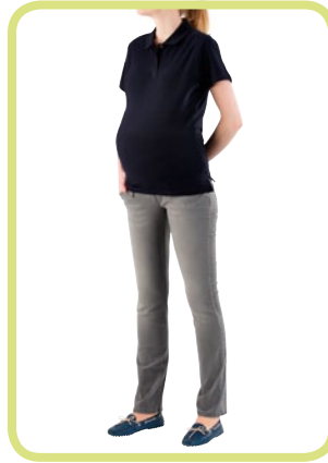
Grey Röhre 131/72 7