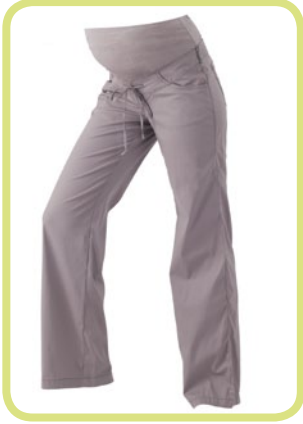
Marlene Wellness Hose Cotton-Mix 579/50 7