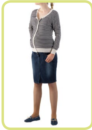
Rock 5 Pocket Style mit kleinem Schlitz 290/19 8