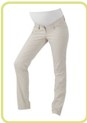
Röhre Satin-Stretch, auch in extra- lang erhältlich 302/120