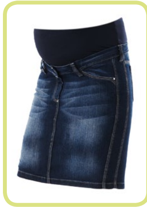
Rock gerade Form 293/95 8