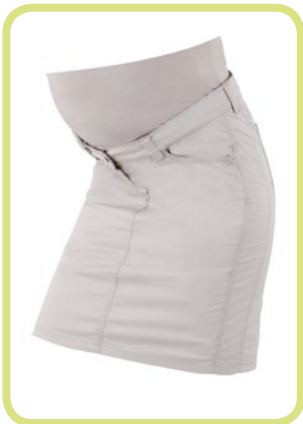
Rock Satin-Stretch 293/120 1