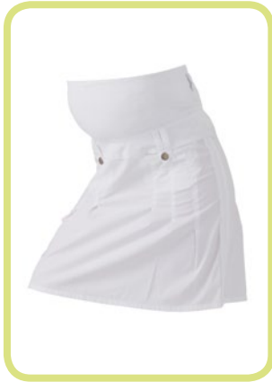
Rock Cotton-Stretch ausgestellt, mit Falten 312/52