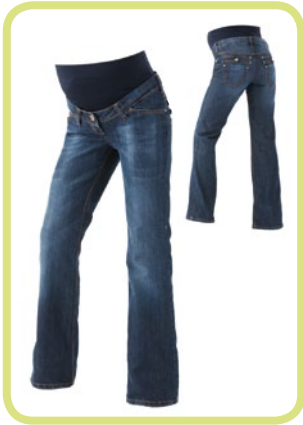
Bootcut mit auffälligen Nähten 363/95 84