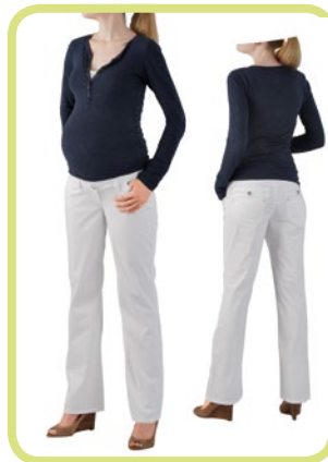
Boot Cut Satin-Stretch mit auffälligen Nähten, auch in extralang erhältlich 363/120 0