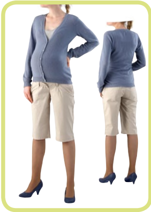
Bermuda 398/51 2