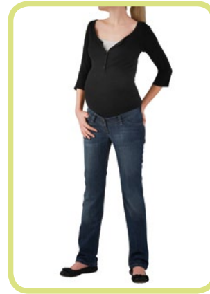
Classic schmale Form 369/95 8