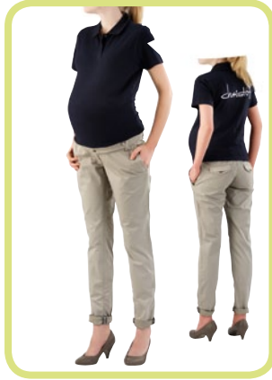
Chino mit verdeck- ten Knöpfen, Taschenklappe 349/57 2