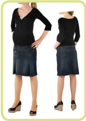
Rock ausgestellt, mit aufgesetz- ten Taschen 413/89 88