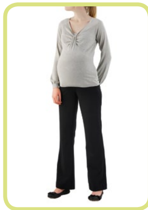
Schlag 752/500 8