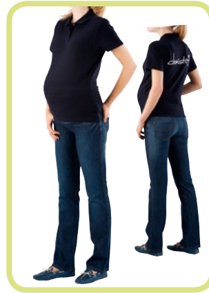
Bootcut Hüftbund mit breitem Gummiband 205/19 80