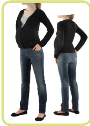
Slim Fit Hüftbund 936/91 80