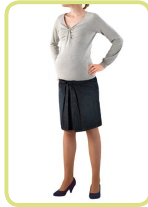
Rock ausgestellt, mit Fältchen 114/14 8