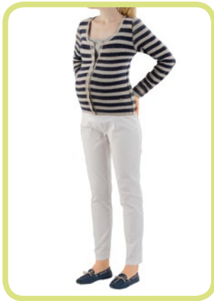
Knöchelhose Cotton-Stretch, mit kleinem Fältchen, Schlitztaschen 929/52 0