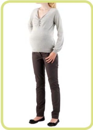
Chino auch in extralang erhältlich 269/51 77