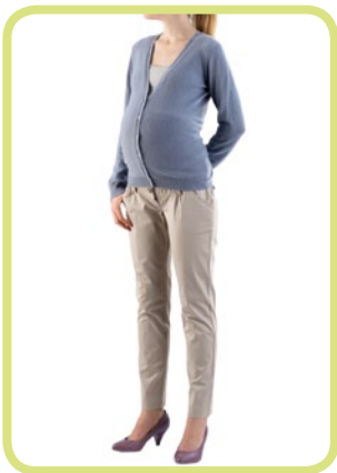
Knöchelhose Satin-Stretch 281/120