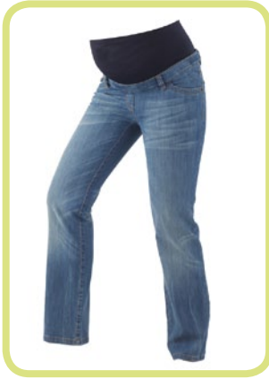
Leichter Bootcut geschlossene Bundlösung mit Knopfloch- gummi, auch in extralang erhältlich 635/89 80