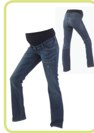
Geraades Bein Kontrastnähte 2-farbig 638/89 8