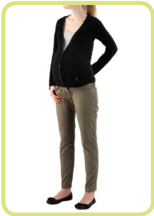
Chino verkürzte Form, zum Krepeln 292/51 60