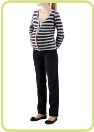
Chino Cotton-Stretch, zum Krepeln, Überlänge 297/52 8