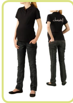
Röhre coole Waschung, auch in extralang erhältlich 19/89 88