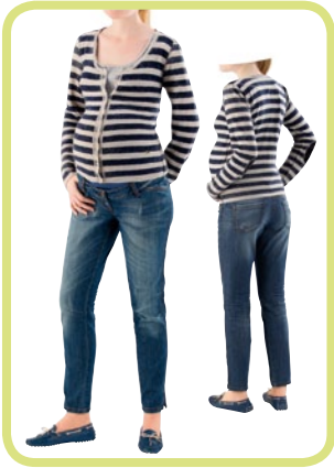
Slim fit Knöcheljeans mit Schlitz 192/91 80