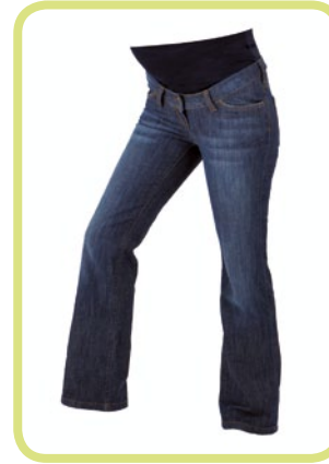
Classic leichter Bootcut, auch in extralang und als Kurzform erhältlich 760/89 80